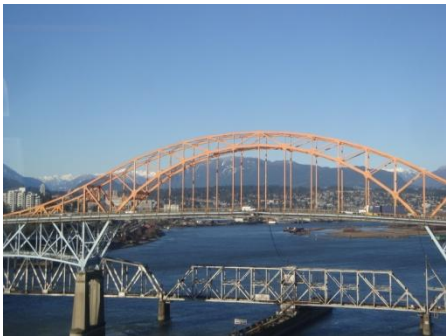
L'un des ponts pour aller de Surrey à Burnaby