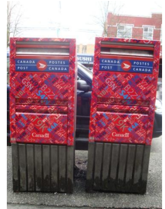
Boîtes aux lettres