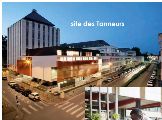
site des Tanneurs

3 rue des Tanneurs BP 4103 37041 Tours Cedex 01