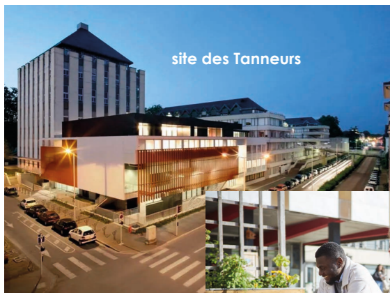
site des Tanneurs

3 rue des Tanneurs BP 4103 37041 Tours Cedex 01